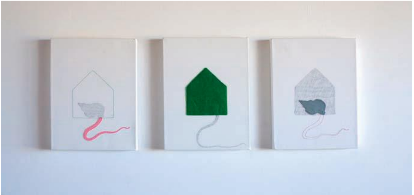
"Una casa" 2007 Técnica mixta Triptico 115 x 27 cm.