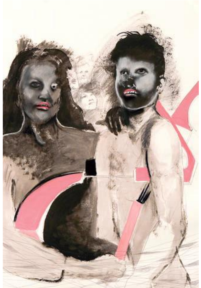
"Sentimientos encontrados I" 2009 Técnica mixta sobre papel 100 x 70 cm.