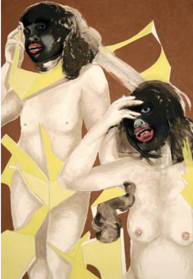
"Sentimientos encontrados IX" 2009 Técnica mixta sobre papel 100 x 70 cm.