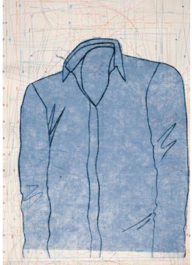
"Unisex" 2009 Carborundum, punta seca y fonditos 100 x 70 cm.