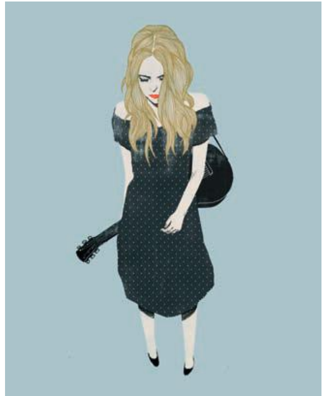
"Antony" 2008 Ilustración digital 42 x 29,7 cm