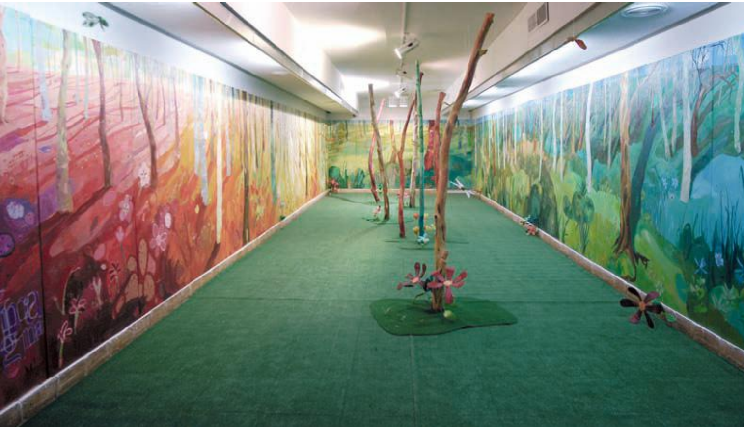
"Viajando el Paraiso" Instalación Serie de 24 lienzos de 195 x 97 cm. Troncos de madera, césped artificial, alambre y papel. Medidas variables Pieza de sonido: ambientación de pájaros