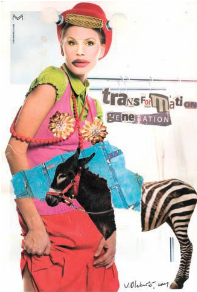
"Generación de transformación" 2009 Collage de papel