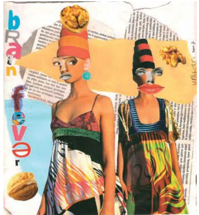
"Fiebre cerebral" 2007 Collage de papel