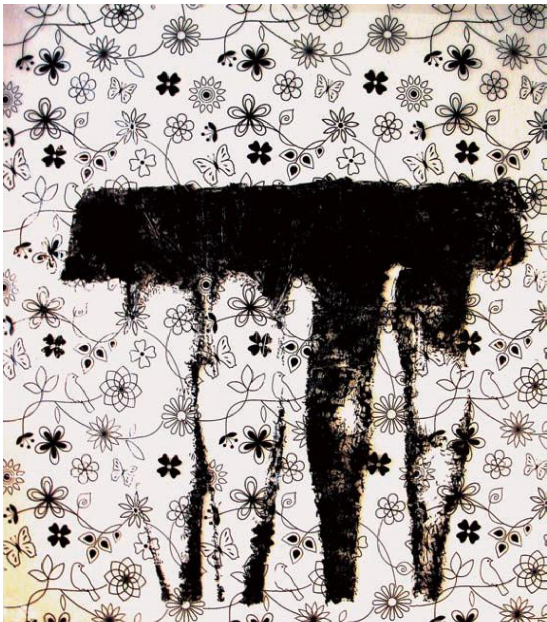
"Siamesas" (de la serie Psicosis ) 2009